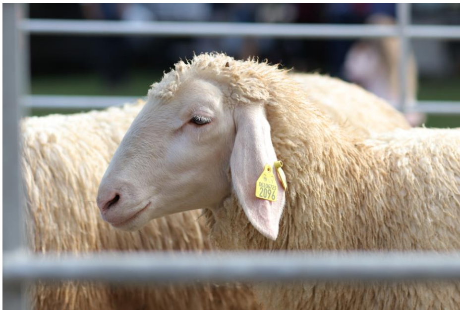
1. att. Vācijas merino vietējās šķirnes aita.

Vācijas merino vietējā aitu šķirne veidota, krustojot vietējās aitas ar Merino šķirnes teļiem, kurus Vācijā ievada no Francijas un Spānijas. Šķirne reģistrēta 1951. gadā. Aitām spēcīga konstitūcija, garš ķermenis, labi veidots eksterjers. Dzīvnieki augstkājaini, ar garām nokarenām ausīm. Vilna balta, segmati uz galvas un kājām balti (1. att.). Aitas izturīgas, piemērotas turēšanai kalnainos apvidos. Aitu mātes pienīgas, tām ir nesezonāla meklēšanās.